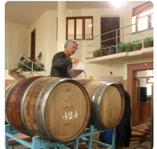
יקב נאות סמדר