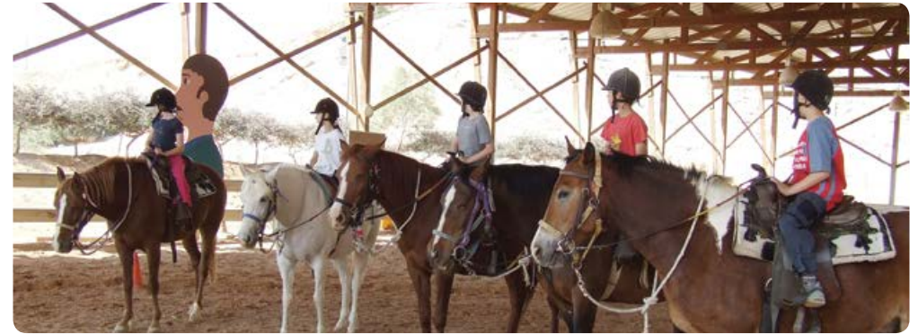
חוות הרכיבה גרופית