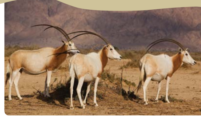
שמורת חי-בר יטבתה