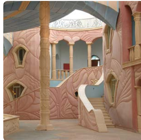
בית האומנויות - נאות סמדר

קיבוץ נאות סמדר | סיור עצמאי - 054-9798966, סיור מודרך - 054-9798957 visit@neot-semadar.com | www.neot-semadar.com