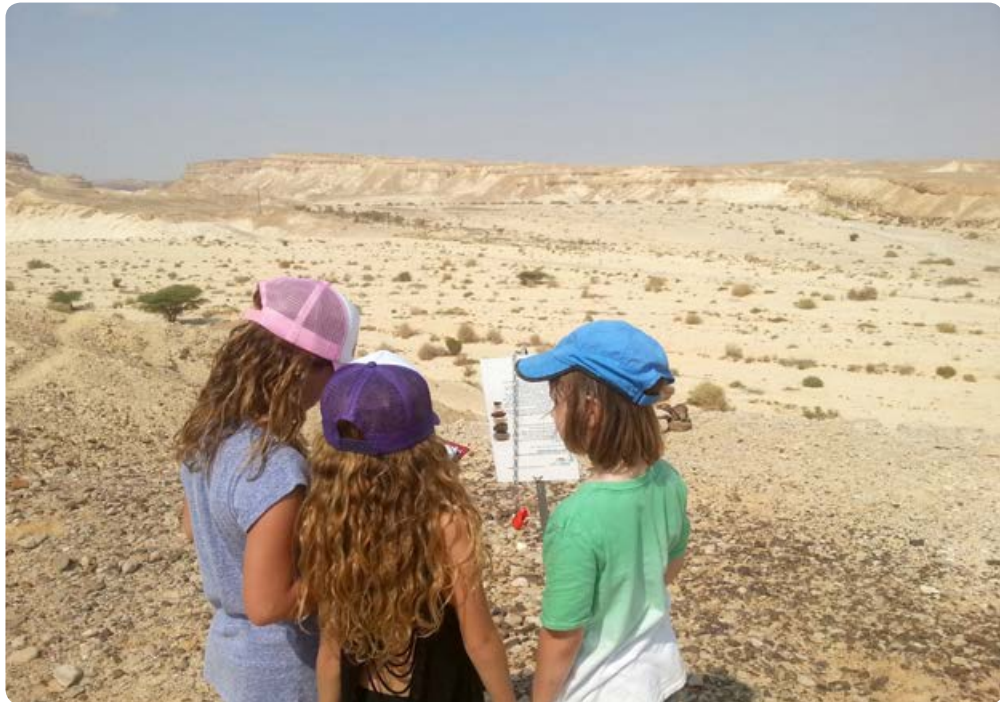
משחק ניווט מדברי

www.nofzuqim.co.il | orders@nofzuqim.co.il | 08-6584748 | צוקים