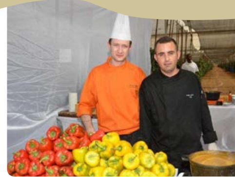
סיוור קולינארי בחממות