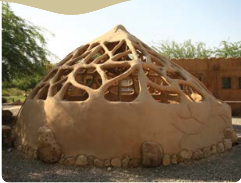
כיפת אירוח אקולוגית