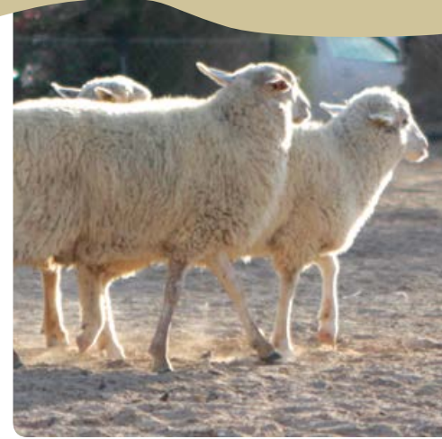
חוויה כפרית במשק צאן