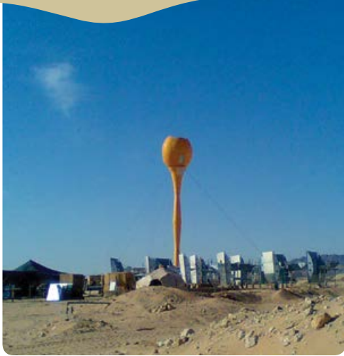
מתקן סולרי בקיבוץ סמר