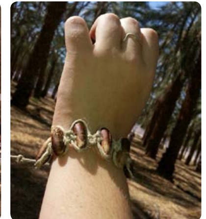
יצירה מעץ התמר | אתרי ביקור ואטרקציות