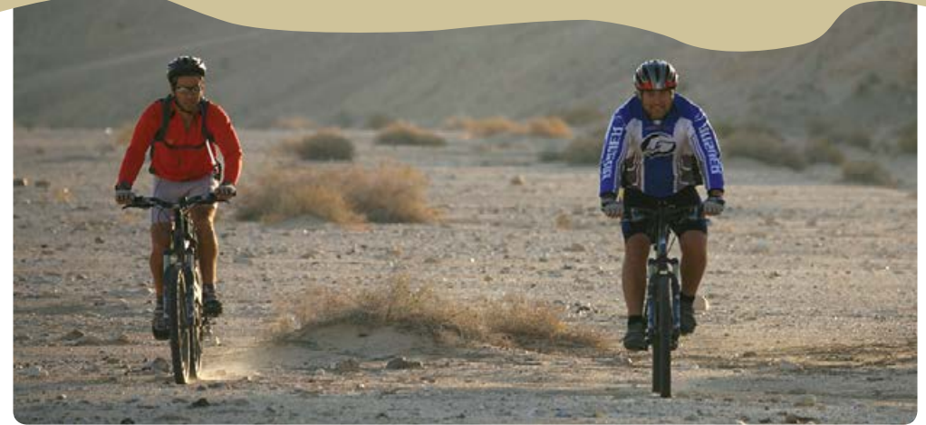
דרכי הבשמים באופניים