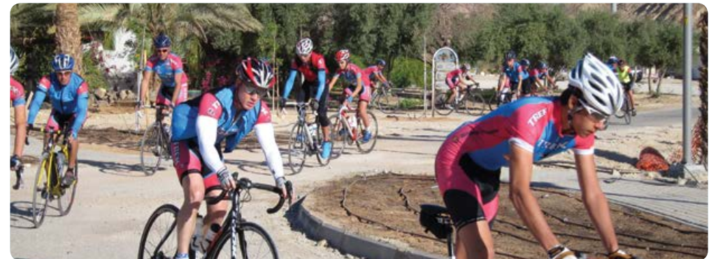
סיור אופניים ביהל

קיבוץ יהל | 08-6357967/8 | www.maayanbamidbar.co.il