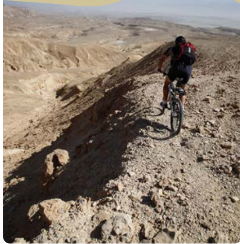
טיול אופניים בערבה