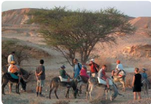
חאן דרך הבשמים