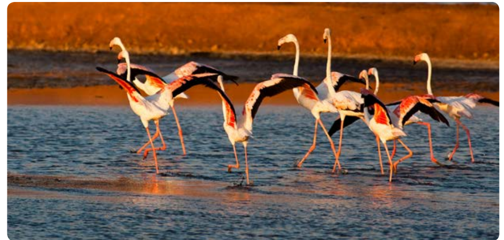
סיוורים בכריכות המלח

כ-3 ק"מ צפונית לאילת | 1-700-703-710 | www.eilot.co.il