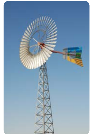
אתרי ביקור ואטרקציות