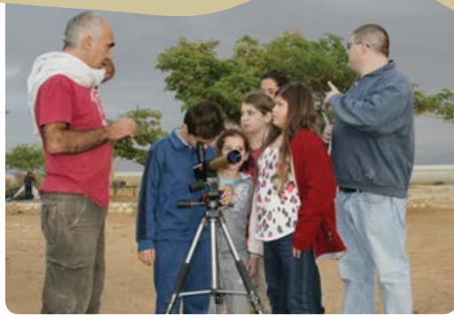
בית ספר שדה חצבה