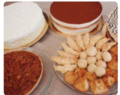
דברים של טעם