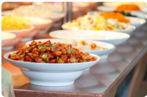
מסעדת "כפות תמרים"