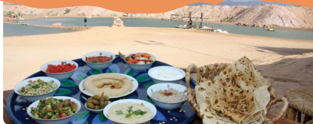
חאן המלך שלמה