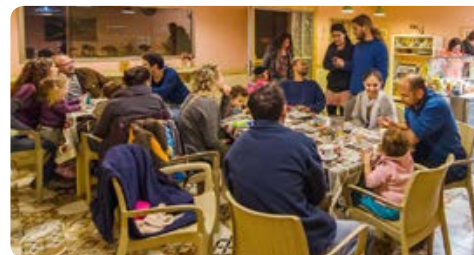
יוגורטריה גרטרוד פארן

052-5450800, 052-8666036 www.gertrud-yogurt.co.il