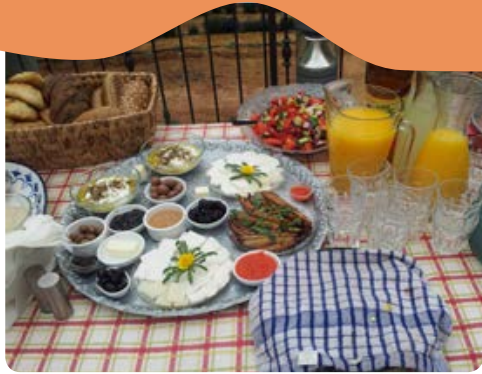
ורד אוהבת לבשל