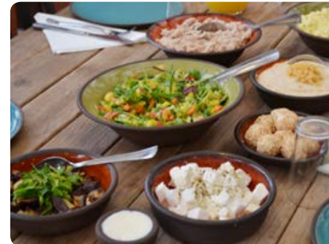
מירב מרקס - קייטרינג ועוד