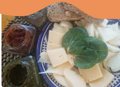
בית התה בלוטן