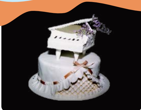
עוגות מעוצבות לאירועים