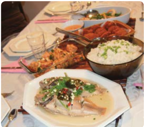
המטבח של פריי