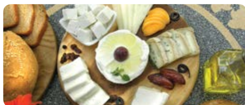
פונדק נאות סמדר

שעות פתיחה א' - ה' 07:00-19:00 שישי וערב חג - 07:00-15:00 שבת - 12:00-18:00 | 08-6358180