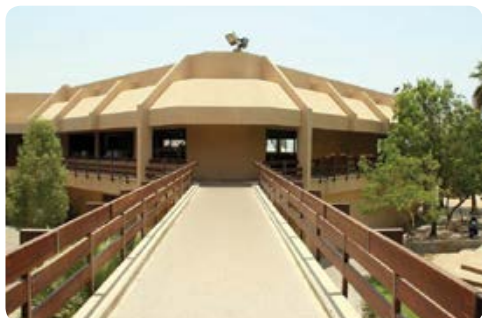
מסעדת "כפות תמרים"